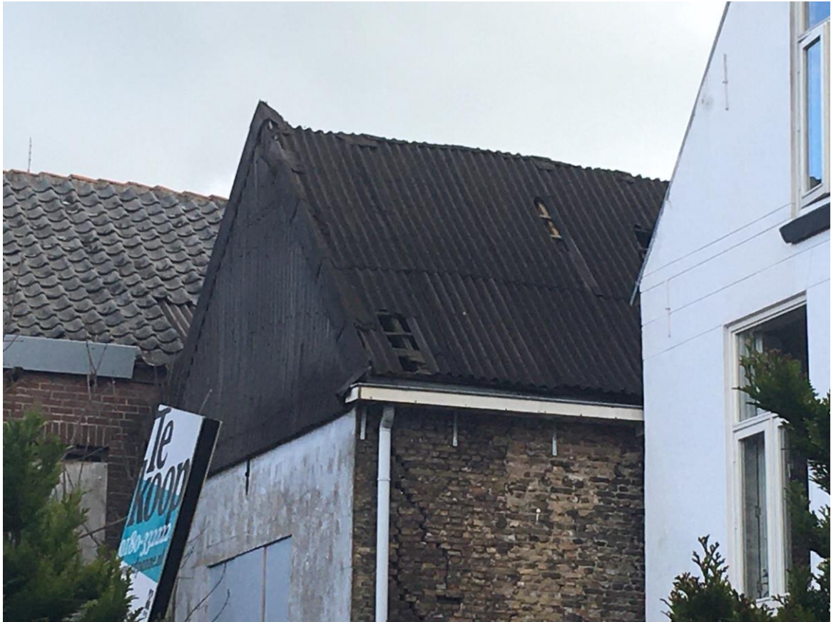
Foto 1 Zijvlak dak met beschadigde bitumineuze golfplaten