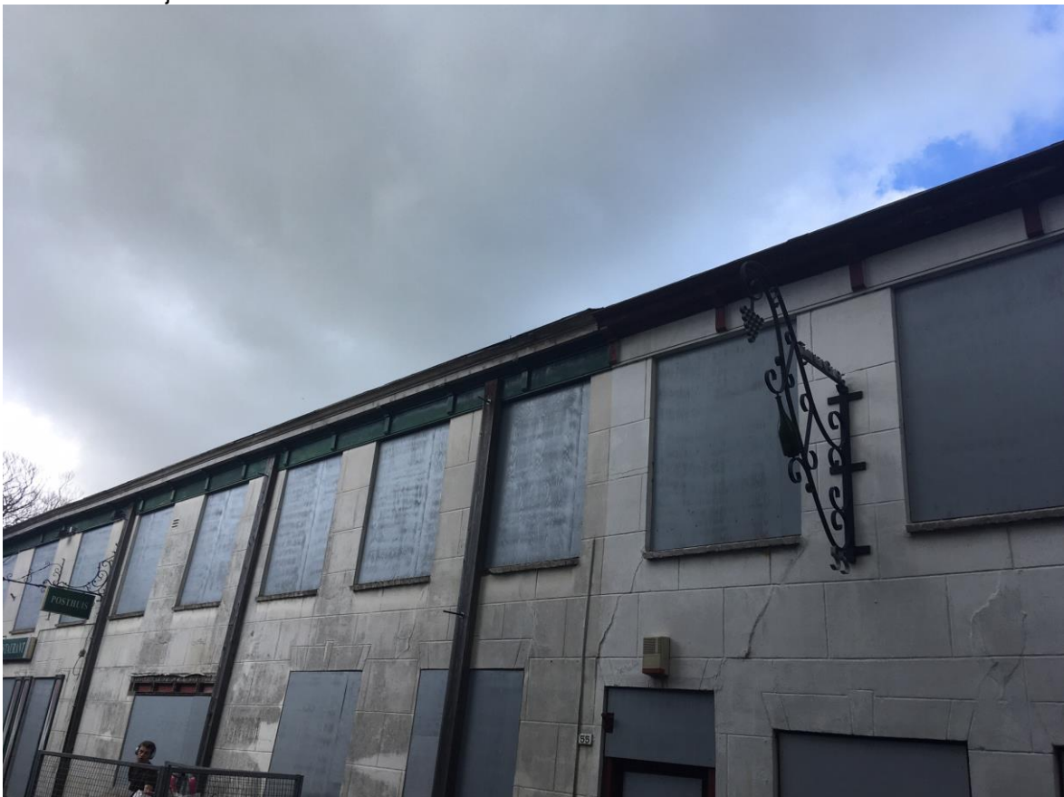
Foto 4 Voorzijde Posthuis vanuit de Dorpsstraat