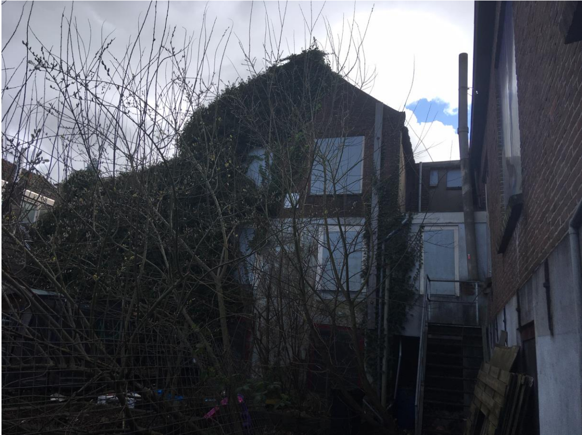
Foto 3 Achterzijde Posthuis vanuit de West Buurtstraat